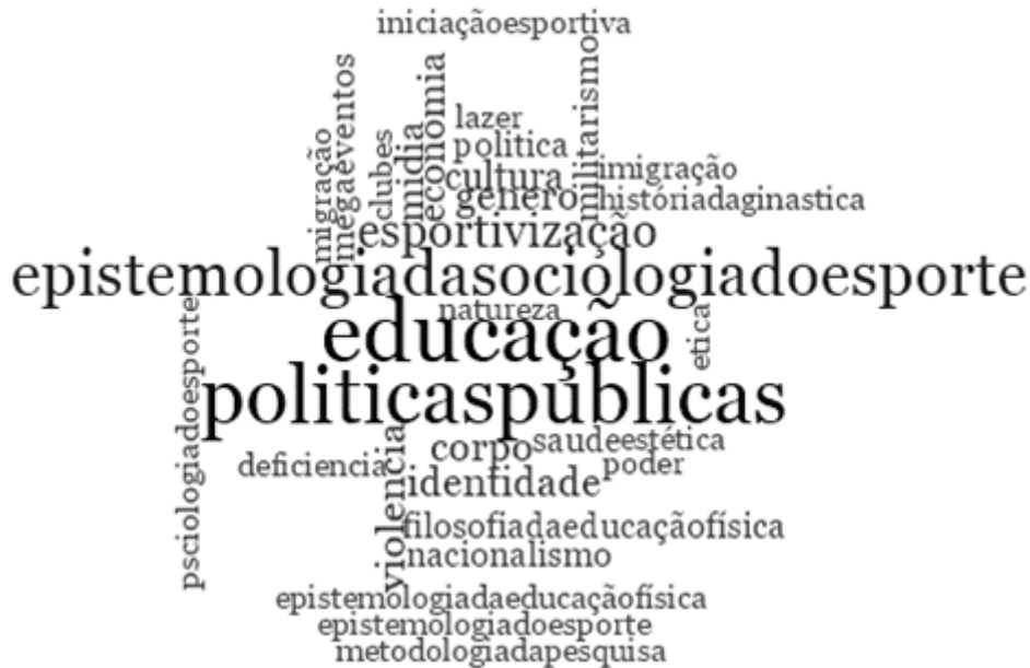
FIGURA 3 Assuntos mais recorrentes nas publicações do JLASST.

três artigos, respectivamente. As demais palavras encontradas na nuvem de palavras se apresentaram apenas em dois ou em uma única publicação do JLASST.