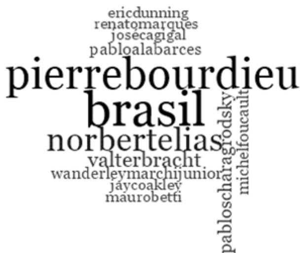
FIGURA 4 Autores mais citados nas referências dos textos publicados no JLASSS.

Na figura 4 estão contidos apenas os autores que tiveram seus nomes referenciados mais de onze vezes nos textos catalogados. Nesse sentido, declara-se que os dados apresentados nessa seção não são engessados e nem têm a pretensão de expor ou ocultar os demais autores, apenas optou-se pela melhor visualização gráfica e, assim, fornecer um cenário das referências mais utilizadas nos estudos publicados. No total, foram catalogadas 2.734 referências declaradas nos 124 textos do JLASSS.