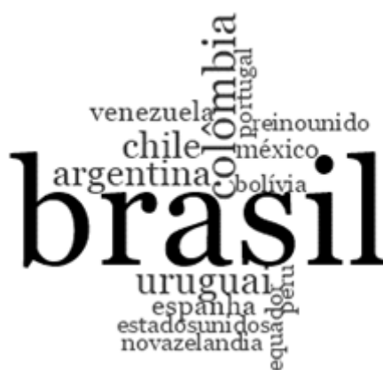
FIGURA 2 Países de vínculo dos autores e artigos publicados no JLASSS.

Apresentar os países que mais tiveram suas instituições vinculadas aos autores e artigos publicados no JLASSS pode nos oferecer indícios para constatar se a missão de aglutinar estudos socioculturais do Esporte latino-americanos está sendo efetivada na respectiva revista. Os países que aparecem na Figura 2 estão diretamente ligados às instituições dos autores que publicaram no JLASSS. O Brasil, em proporção maior e centralizado na imagem, apareceu como o país de vínculo em 76 artigos, seguido da Colômbia, em 11 textos, e Argentina e Uruguai, com oito publicações. O Chile consta em sete publicações, já a Venezuela e a Espanha comparecem em três trabalhos, e Portugal em dois. México, Equador, Estados Unidos, Bolívia, Peru, Reino Unido, Canadá e Nova Zelândia aparecem pelo menos uma vez nas páginas da revista.