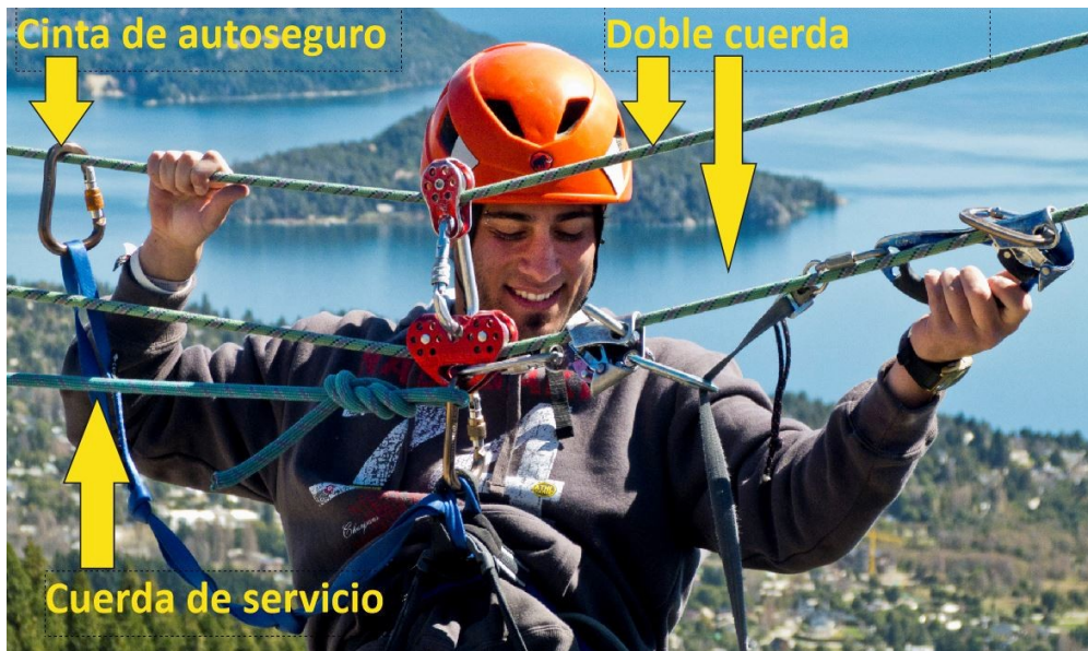
Figura 13. Detalle del sistema de seguridad de tránsito en tirolesa por cuerda doble

ESCALADA DEPORTIVA EN MURO y MINI MURO. Al respecto se presentó un trabajo en el VI Congreso Nacional y IV Internacional de Investigación Educativa en la ciudad de Cipoletti, Universidad Nacional del Comahue al que remitimos.