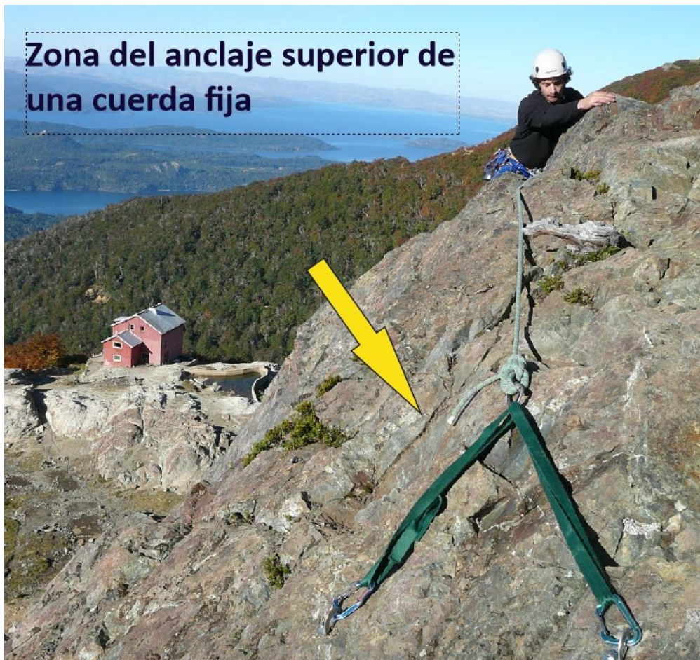
Figura 7. Detalle de la reunión final en el sistema de tránsito por cuerda fija en escalada en roca