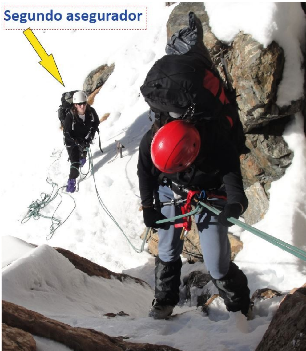
Figura 5. Redundancia en el sistema de aseguración en una práctica de trekking con dificultad técnica en nieve

hacia abajo, movimiento del prusik, acompañando el descenso.