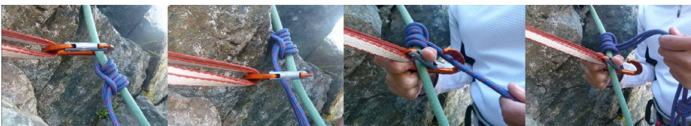
Figura 9. Detalle del pasaje sin desasegurarse, del nudo prusik por uno de los tramos de la cuerda fija (mosquetón pasante)