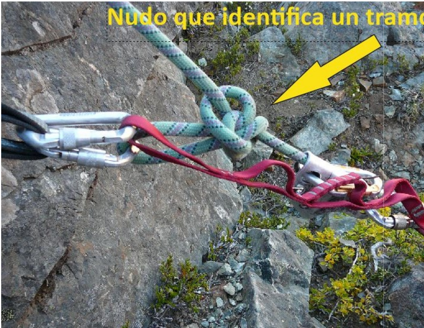
Figura 8. Detalle sobre la individualización de los tramos del sistema de ascensión por tránsito en cuerda fija