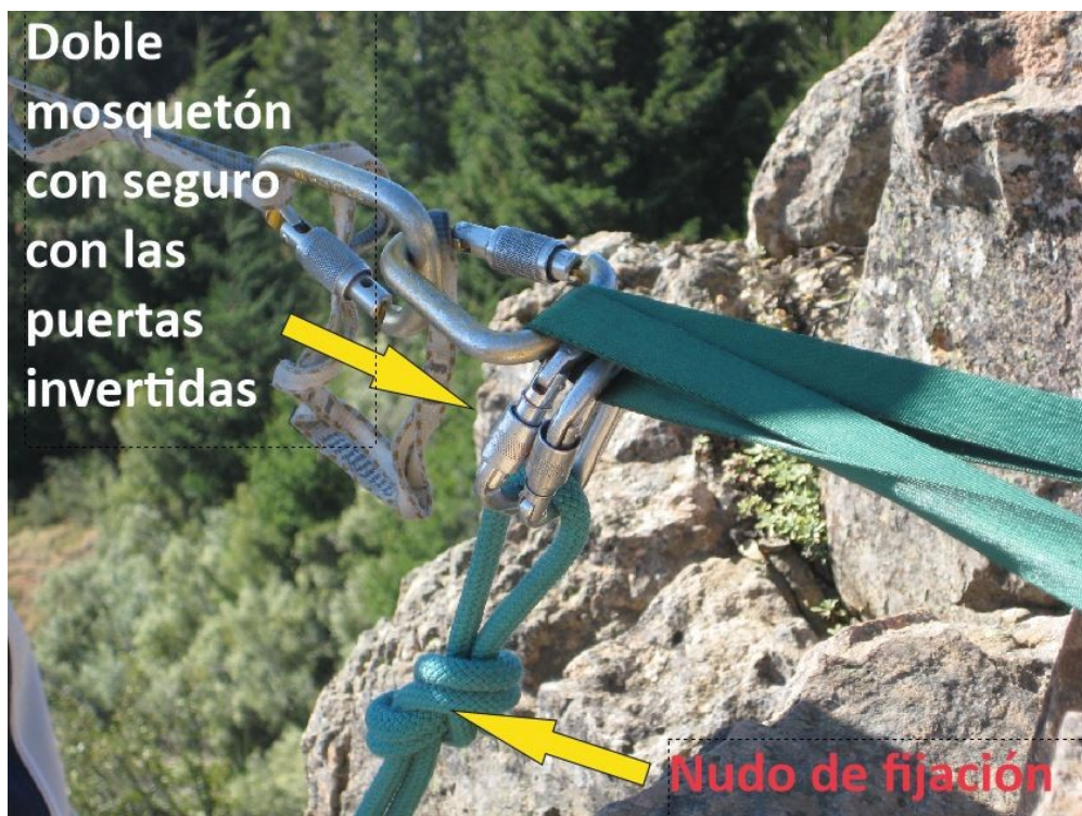
Figura 4. Detalle sobre la redundancia del doble mosquetón con seguro en una reunión en escalada en roca