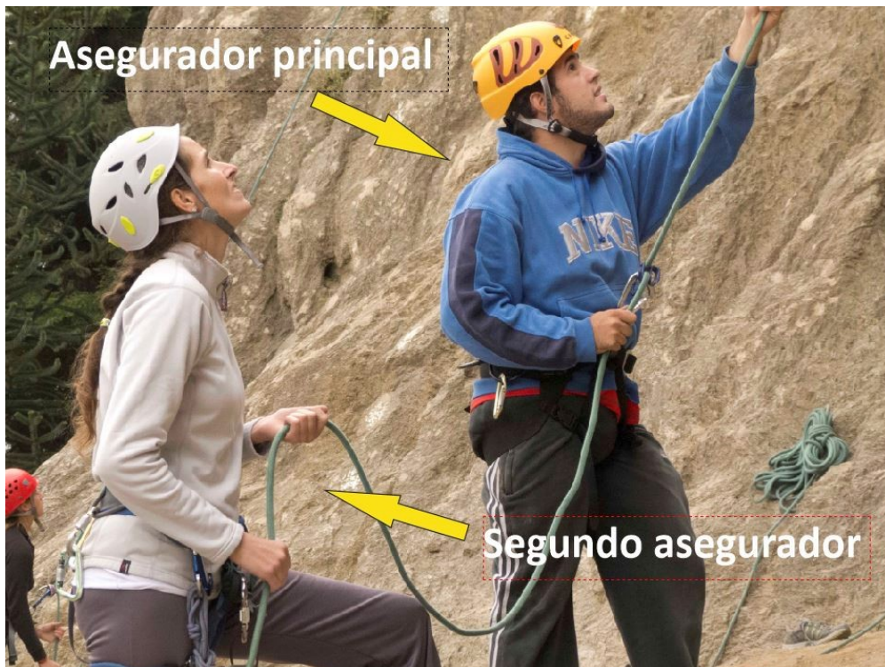
Figura 3. Redundancia en el sistema de aseguración en una práctica de top rope en escalada en roca

Todo esto será posterior a la evaluación de la calidad del terreno (roca, nieve y/o hielo), de los anclajes a utilizar y el material técnico específico para el armado de la reunión propiamente dicha (cintas, mosquetones y cuerda).