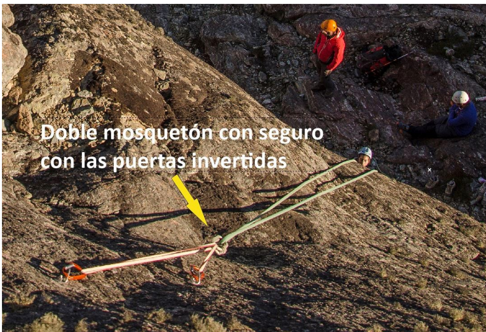
Figura 2. Redundancia en las reuniones de prácticas de top rope en escalada en roca

Un ejemplo concreto se da en el armado de la actividad de escalada con cuerda de arriba, específicamente en el uso de 2 mosquetones con seguro con las puertas invertidas en la zona del descuelgue de la cuerda con el fin de evitar la salida espontánea de la cuerda ( Figura 2 ).