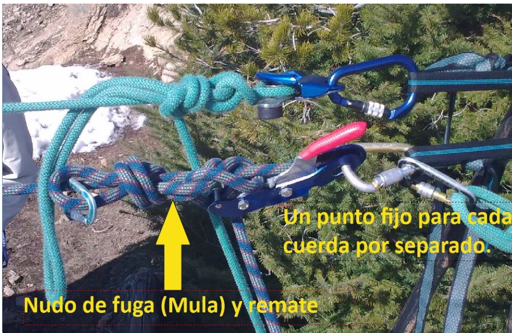
Figura 12. Detalle de la reunión de una tirolesa, del sistema de tensión y reducción