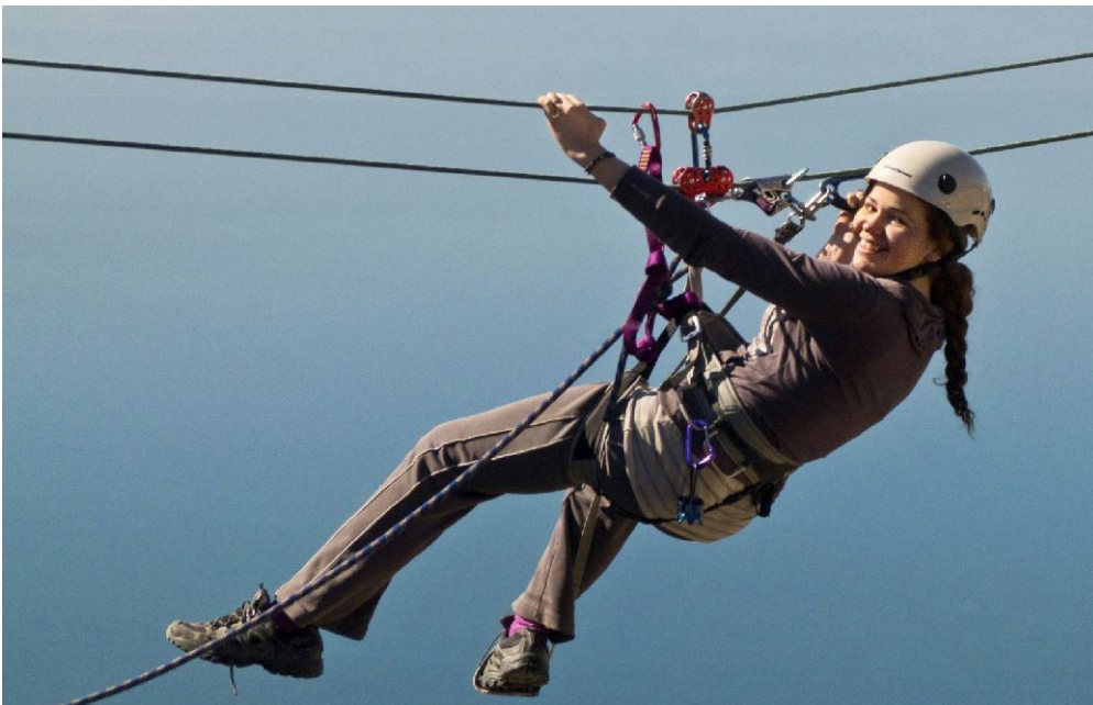
Figura 11. Pasaje de una tirolesa con cuerda doble y con anclajes en roca

TIROLESA , este contenido fue desarrollado con la máxima seguridad dado que se aplican los resguardos propios del uso de tirolesa como sistema de rescate en alta montaña, sin embargo se aplican a las tirolesas de tipo recreativo ( Figura 11 ).