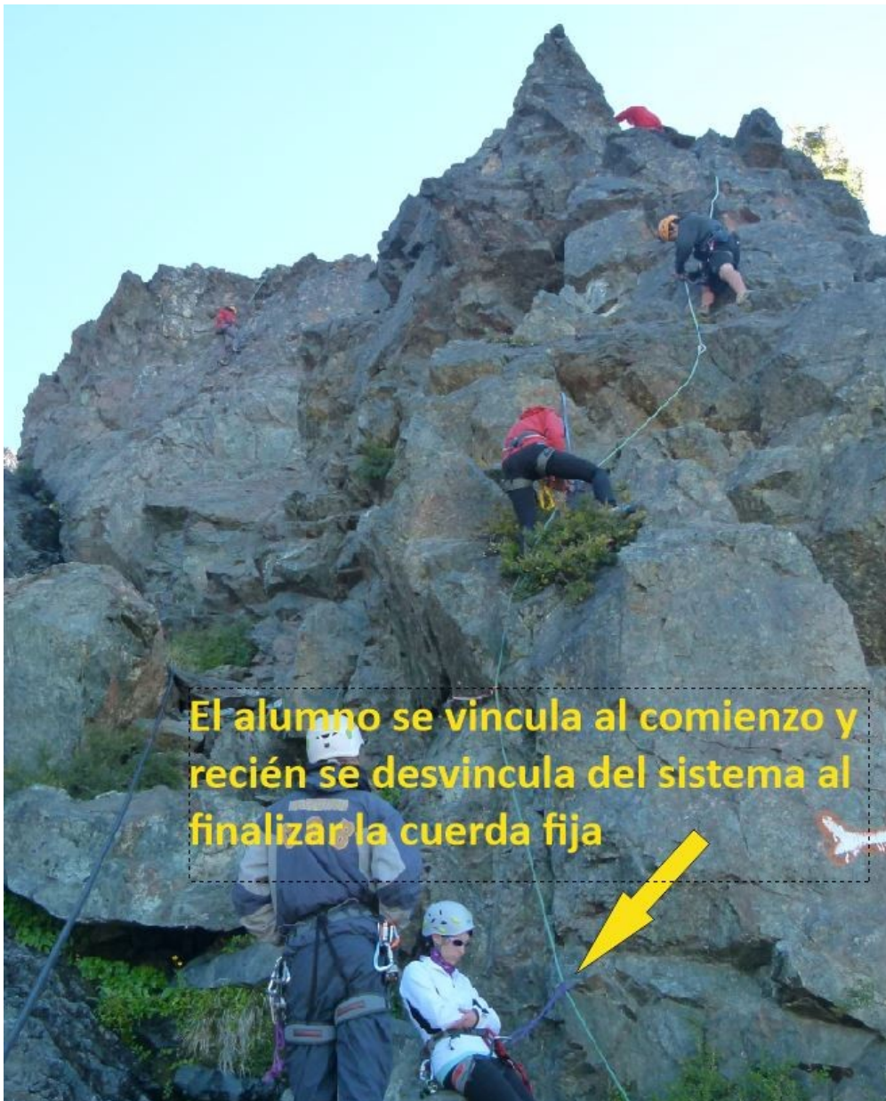
Figura 6. Visualización de las condiciones de seguridad en el comienzo de una práctica de cuerda fija (Foto: Máximo Schneider, 2014)

Algunos aspectos importantes tanto en el armado como en el tránsito son: