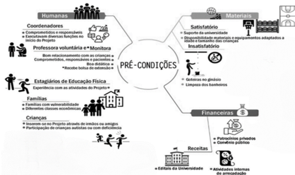
Figura 1 Pré-condições financeiras, materiais e humanas do Projeto Baby Basquetebol.