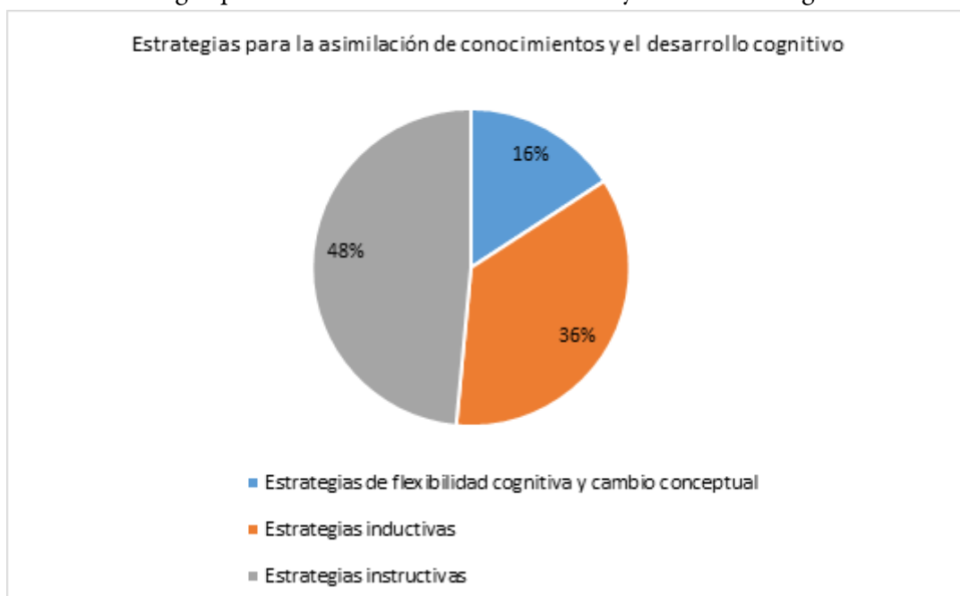
GRÁFICO 2 Estrategias para la asimilación de conocimientos y el desarrollo cognitivo

A continuación, en cada apartado se hará una descripción de la perspectiva de los estudiantes y de los docentes, seguido de un análisis sobre la estrategia en cuestión. Debido a la extensión del manuscrito, no puede incluirse el resultado bruto de las opiniones de docentes y estudiantes, de ser necesario, pedir dicho material a la autora.