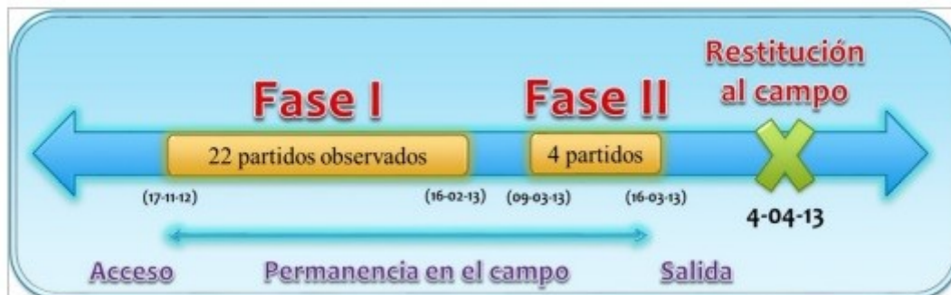
Figura 2. Cronograma del Trabajo de campo.

largo de toda la temporada de partidos de fútbol prebenjamín y dos torneos en los que participaron los equipos de fútbol investigados. Desde Noviembre hasta Abril de 2013 se realizaron 26 sesiones de observación: 22 en una primera fase de trabajo de campo y 4 de contraste. Cada sesión de observación tenía una duración de 90 minutos, 30 minutos de convocatoria previa al partido y calentamiento, 40 minutos de partido, descansos y despedida.