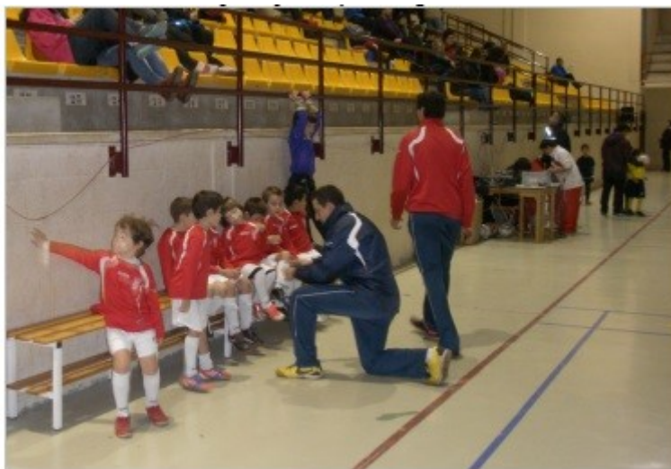
Figura 4. Incomprensión del niño ante la charla táctica del entrenador.

Durante el transcurso del partido se pita penalti a favor del equipo. Los jugadores paran el juego y no saben cómo continuar, esperan alguna explicación sobre qué ha ocurrido. El segundo entrenador comenta a sus jugadores que han pitado penalti y continúan sin entenderlo; posteriormente, yo -que me encuentro más cerca- les aclaro que es penalti y se reorganizan. -15-12-2012-