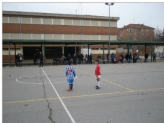
Figura 5. Defensa estático en el medio campo cuando su equipo saca de esquina.

Aunque la inhibición del comportamiento en el jugador se considera imprescindible a la hora de adoptar una estrategia común en equipo para tratar obtener el mayor rendimiento competitivo; cada jugador asume un rol que ha de respetar.