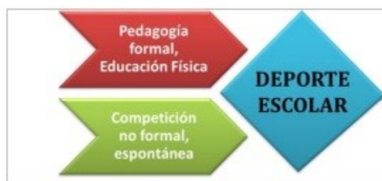
Figura 1. Origen del deporte escolar.

De los párrafos anteriores se desprende una premisa de interés para el estudio el fútbol prebenjamín, como deporte escolar, no es educación física, ya que no forma parte del currículum escolar, pero en su origen y desarrollo está próxima a ella por compartir el carácter formativo.