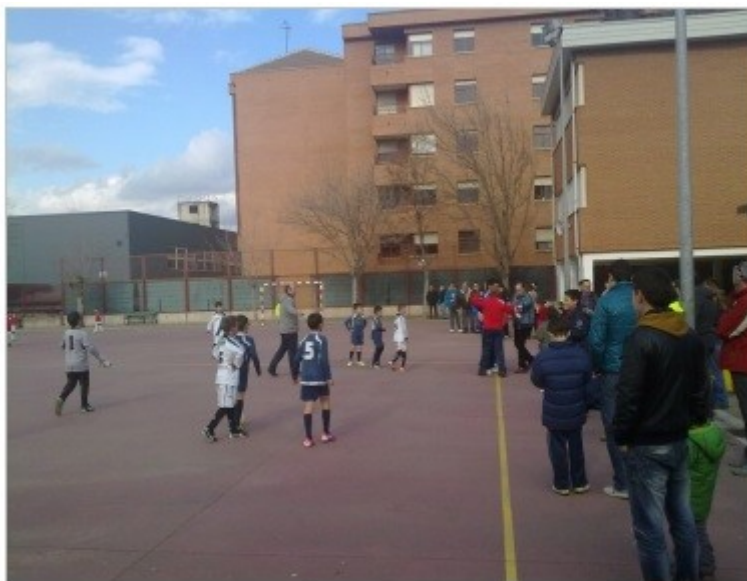
Figura 7 . Falta de deportividad en el entorno adulto llegando a interrumpir el juego.

pueden verter sobre ciertos jugadores o el árbitro, sino por las disputas que entre ellos pueden tener, incluso mientras los niños están disputando el partido.