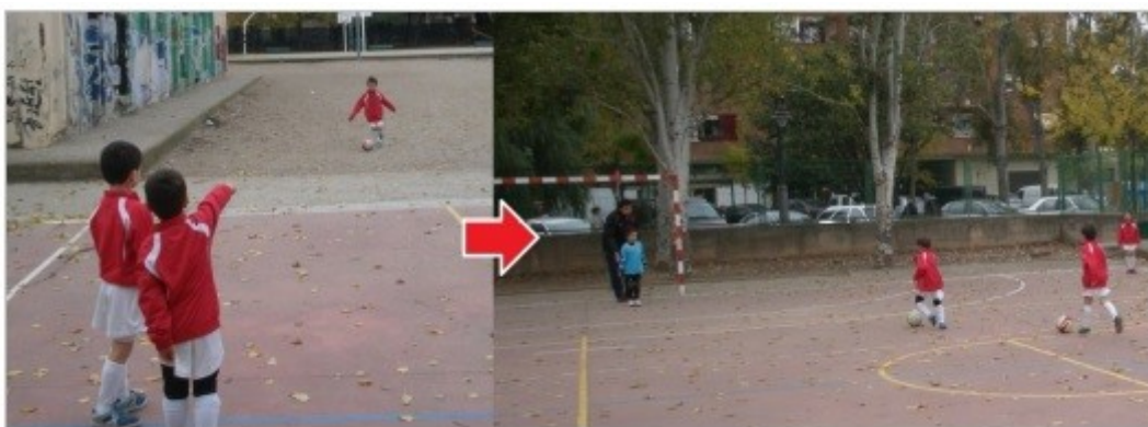
Figura 3. Niño cumpliendo las órdenes del ejercicio sin atender las normas del fútbol.

Del mismo modo, se manifiesta esta ingenuidad en la omisión del cumplimiento de alguna de las normas como: respetar las líneas del campo de fútbol; que el portero no pueda salir del área; o, incluso, que no se beneficien de una interpretación interesada competitivamente de las normas, como no realizar faltas antideportivas. Los niños poseen dificultad para el respeto de normas que se entienden para el adulto como implícitas, como sentarse para atender al entrenador o que los porteros y suplentes observen el partido de sus compañeros durante el partido.