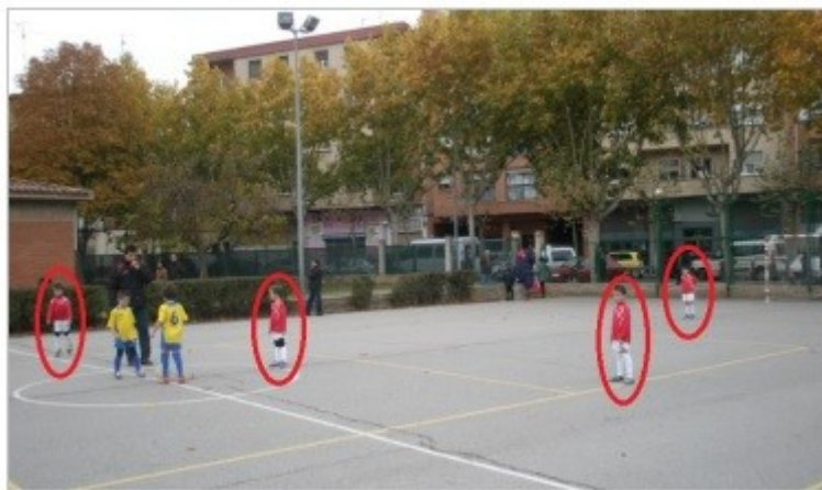
Figura 6. Niños colocados en la posición del campo asignada para comenzar el encuentro.

El niño ha de adaptar su conducta a las demandas estratégicas promovidas por el entrenador, donde cada niño ha de emplearse para tratar de cumplir unas funciones para el equipo. De esta manera, el escenario se hace más complicado, dado que debe entender las funciones del compañero, en tanto que deporte colectivo: en otra ocasión puede ser él quien lleve a cabo su cometido.